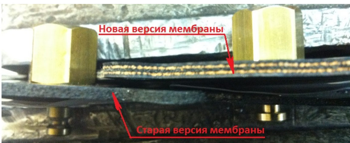
Мембрана: новый состав резины, трёхслойная.